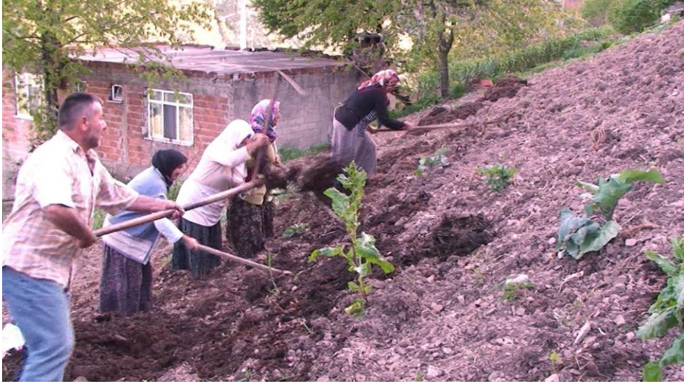
Fotograf III: Mısır Kazma İmececi

fırınlanması köyde varlıklı kimselerin sahip olduğu fırınlarda gerçekleşmektedir. Mısırın fırınlanması yardımlaşma yoluyla ve sıra ile yapılmaktadır (KK:4).