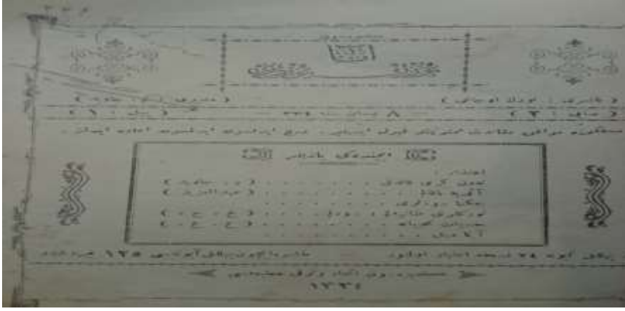
Belge-3: Giresun Ana Türk Yurdu Mecmuası 2. Sayı Ön Kapağı (Ata Türk Yurdu, 1918, 2/ Ön Kapak).