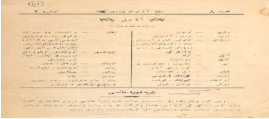
Belge – 11: Ana Türk Yurdu Mecmuası, Sayı: 2, Sayfa:8 8