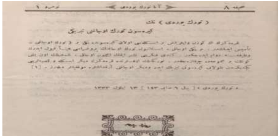
Belge- 2: Türk Yurdu'nun Giresun Türk Ocağı'nı Tebriğinin Ana Türk Yurdu'nda Yayınlandığını Gösterir Sahife (Ata Türk Yurdu, 1917, 1/8).