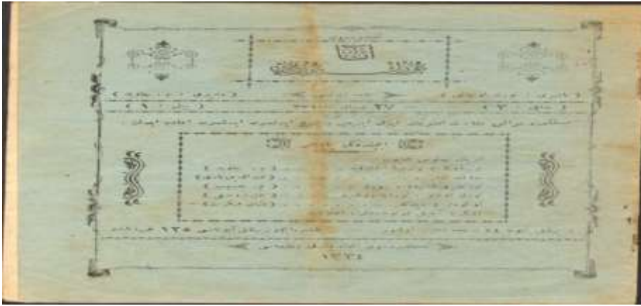
Belge-5: Giresun Ana Türk Yurdu Mecmuası 3. Sayı Ön Kapağı (Ata Türk Yurdu, 1918, 3/Ön Kapak)).