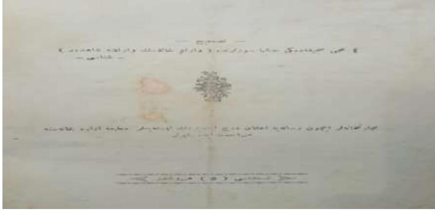
Belge-4: Giresun Ana Türk Yurdu Mecmuası 2. Sayı Arka Kapağı 7

Giresun Ana Türk Yurdu Mecmuası ön ve arka kapakta genel itibariyle aynı bilgilere yer vermiştir. Özellikle arka kapakta sadece risaleye ilan vermek isteyenlerin matbaaya başvurmaları gerektiği ve dergi nüshasının 5 Guruş olduğu belirtilmiştir. Ancak sadece ikinci sayıda farklı bir uyarı metni yayınlanmıştır.